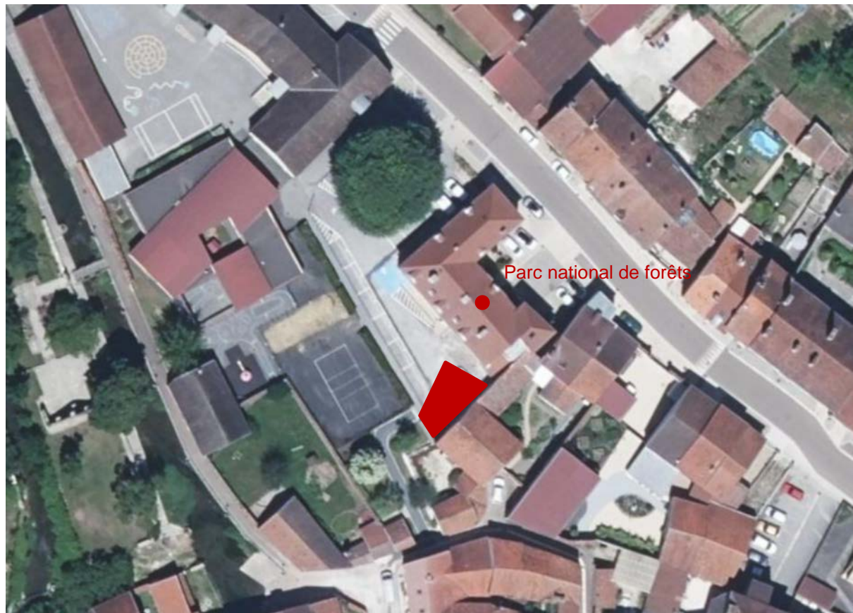
2 Vue aérienne du site et localisation de l'emplacement de l'œuvre.