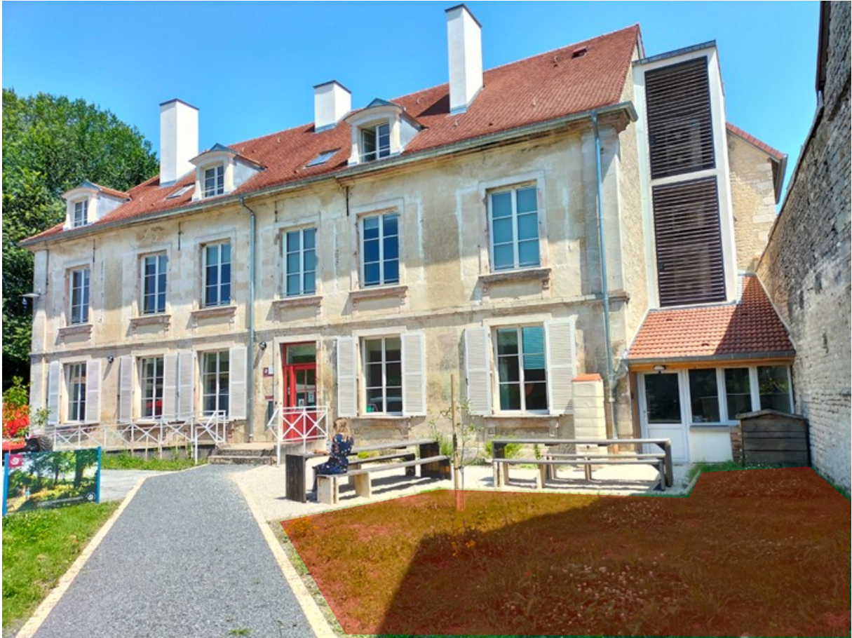
3. En rouge, au sol : emprise de la parcelle destinée à accueillir l'œuvre.